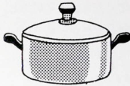
イ： なべ 鍋