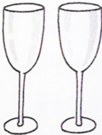
エ：ペアのワイン グラス