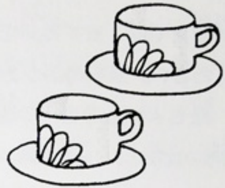
ウ：ペアのコーヒー カップ