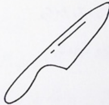
オ： ほうちょう 包丁