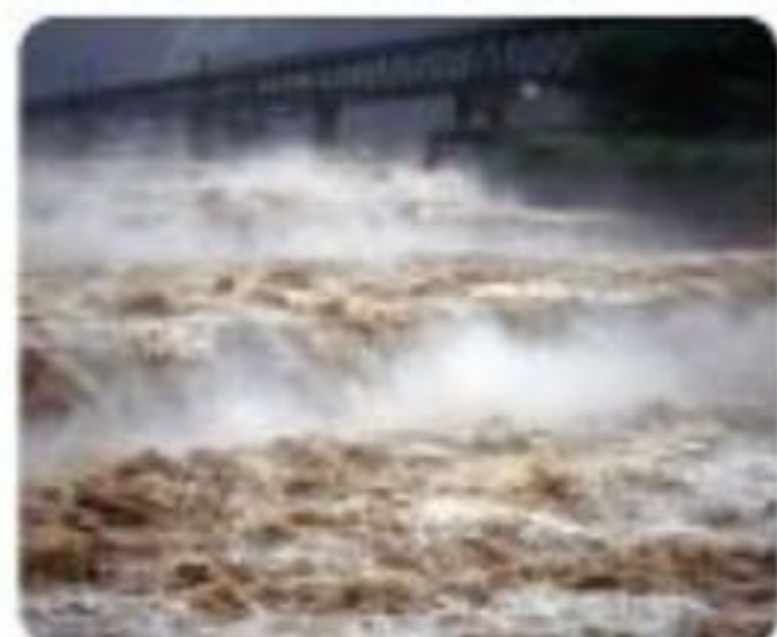
日本有数の急流、富山県の常盤寺川

日本の山は斜面が急で、山から海までの距離が短い。そのため、日本の川は、世界の川と比べると長さが短く、流れが急だ。明治時代に、日本の川を見た外国人が「川ではなく滝だ!」と言ったという。