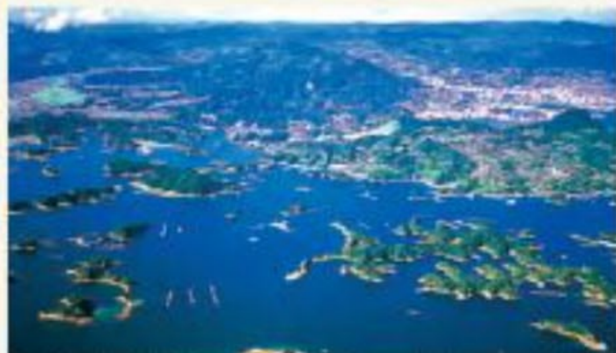
長崎県北松浦半島四岸の九十九島。200以上の島がある

から日本海へ注ぐ。2位の利根川は、その川に水が集まる面積が日本一だ。3位の石狩川は、大正時代に工事で川の流れを変えるまでは1位だったという。