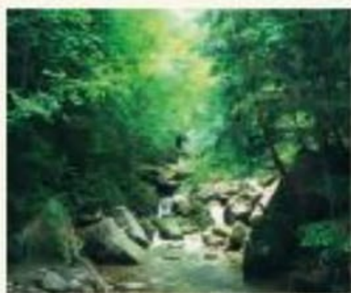
長野県川上村にある千曲川(信濃川)の源流

現在、日本一長い川は、長さ367kmの信濃川。長野県では千曲川と呼ばれ、新潟県新潟市