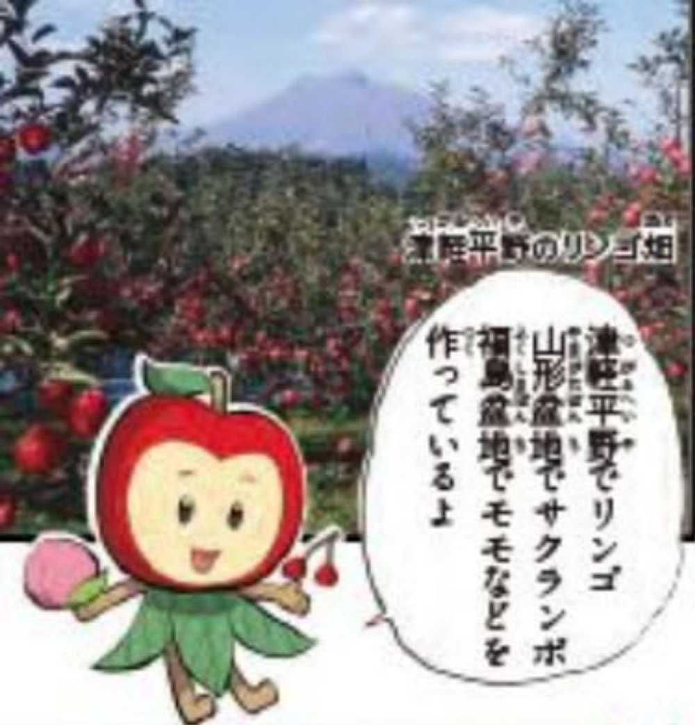
津軽平野のリンゴ畑