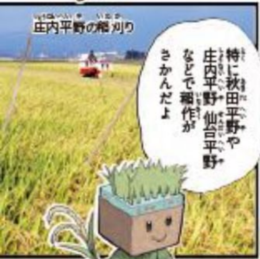
庄内平野の稲刈り