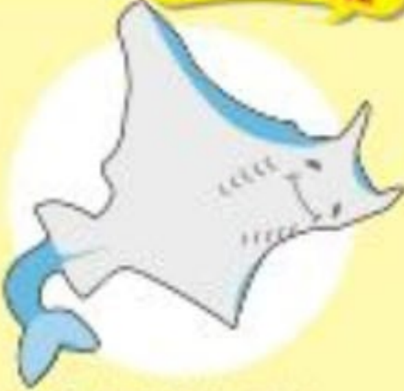
Eイがはねるよ北海道