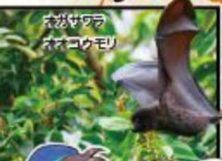
ネガサワラ ネオコウモリ