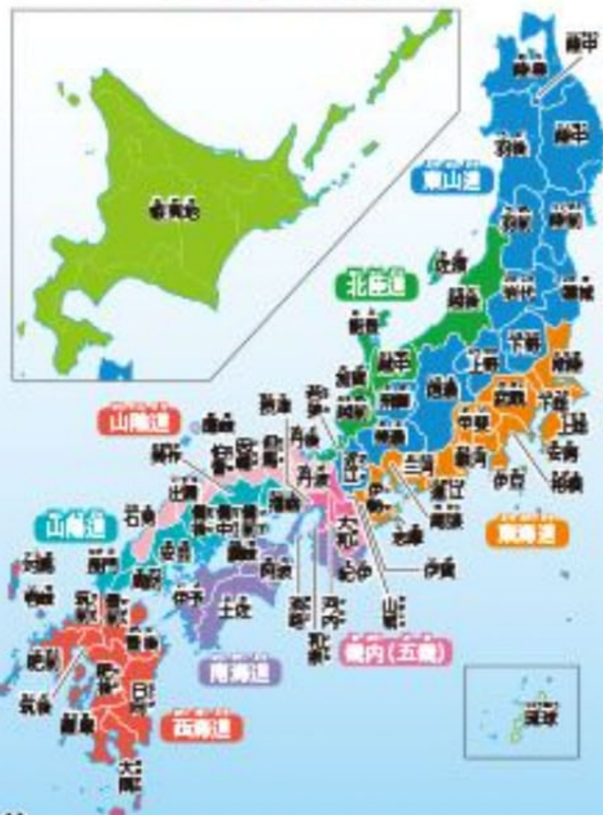
【五畿七道と昔の国名】

昔の日本は、今の都道府県より細かい「国」があり、京都周辺の「畿内」と7つの地方(五畿七道)に分けられていた。今でも「東海道新幹線」や「阿波踊り」などに残っている。