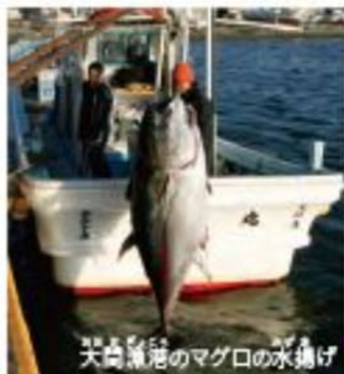
大間漁港のマグロの水揚げ

大間町に水揚げされる天然クロマグロは、高級な「大間マグロ」として有名。これまでにいた最高値は1匹1億5540万円だ。