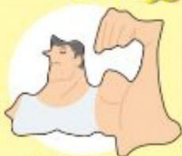
筋肉モリモリ 青森県

本州でいちばん北にあり、涼しい気候を利用して、日本一リンゴを多く作っている。漁業もさかんでマグロやイカ、ホタテが有名だ。