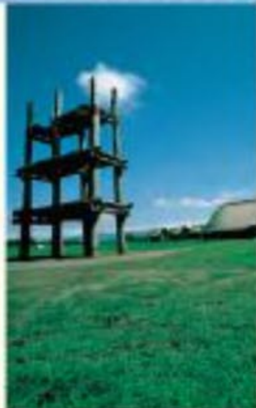
大型組立柱建物(復元)

歴史と文化 青森市の三内丸山遺跡は、約5500年から4000年前の日本最大級の縄文時代の遺跡。縄文人がムラをつくり、ほかの地域と交流していたことがわかった。