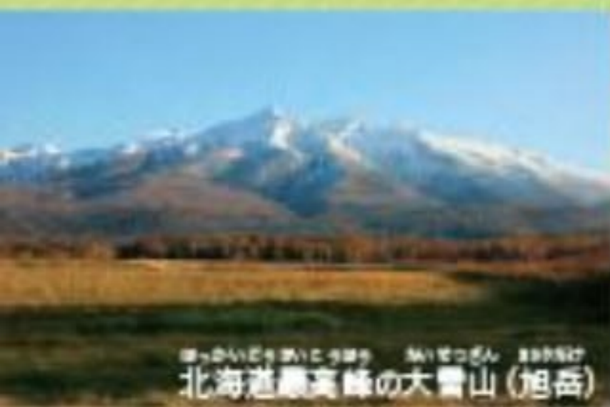
北海道最高峰の大雪山(旭岳)

自然と気候 日本で最も北にあり、夏は短く、冬は長くて寒さが厳しい。中央に北見山地、石狩山地、日高山脈が並び、海に囲まれている。