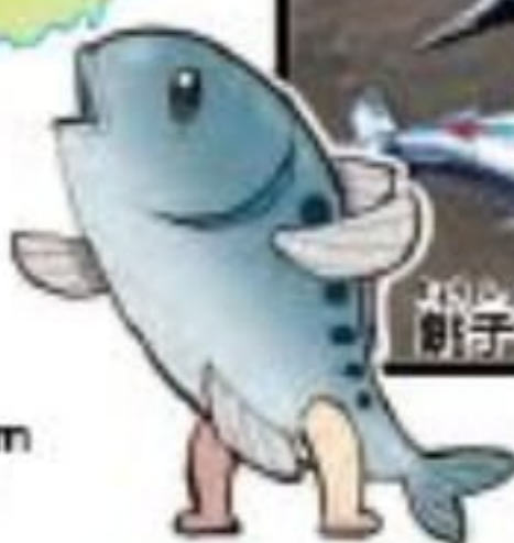
銚子港に水揚げされたマグロ