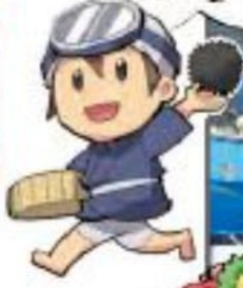
岩手県の大船渡港