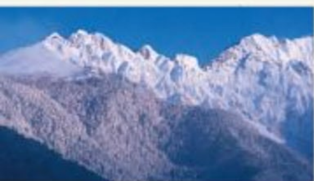
本州の中央に連なる飛騨山脈(北アルプス)の穂高連峰。主峰は奥穂高岳

大小たくさんの島々からなる日本。 日本列島全体が巨大な山脈のように山が連なり、 山からまわりの海へ多くの川が注いでいる。