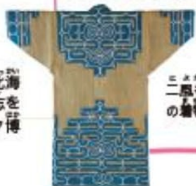
二風谷アットウシの織物

平取町の「二風谷アットウシ」は古くからのアイヌの織物。文様には魔よけの力があるともいわれている。