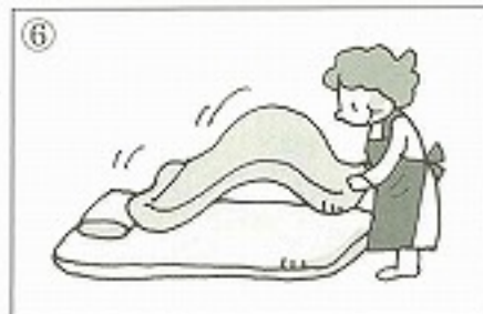
⑥布団を _____。 ( )