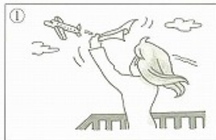
①ハンカチを _____。 ( )

I 次の絵は何を表していますか。表から漢字を選んで _____ に入れ、読み方も書きなさい。