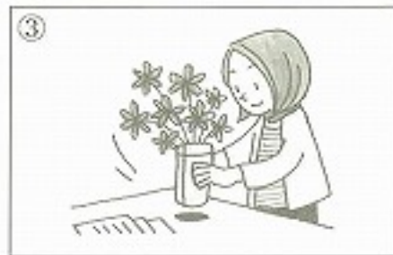
③机の上に花を _____。 ( )