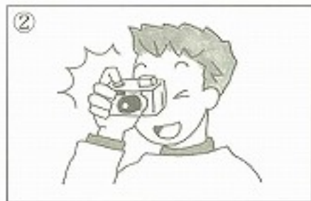
②写真を _____。 ( )