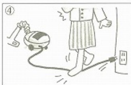
④コードを _____。 ( )