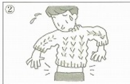
②セーターが _____。 ( )