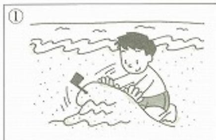
①砂の山を _____。 ( )

I 次の絵は何を表していますか。表から漢字を選んで _____ に入れ、読み方も書きなさい。