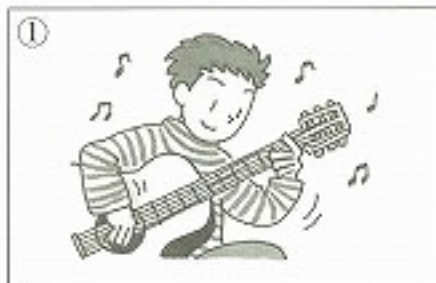
①ギターを _____。 ( )

I 次の絵は何を表していますか。表から漢字を選んで _____ に入れ、読み方も書きなさい。