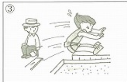
③遠くへ _____。 ( )