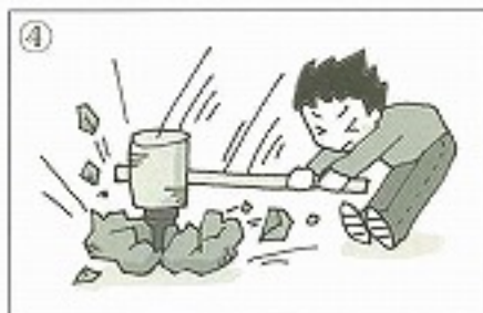
④岩を _____。 ( )