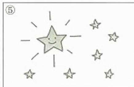
⑤星が _____。 ( )