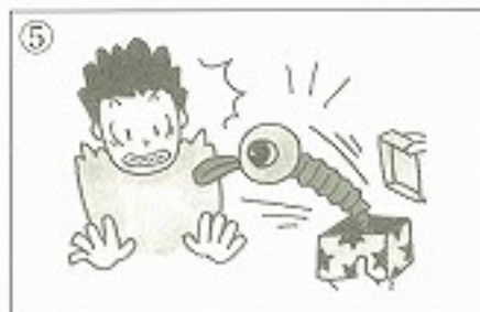
⑤友達を _____。 ( )