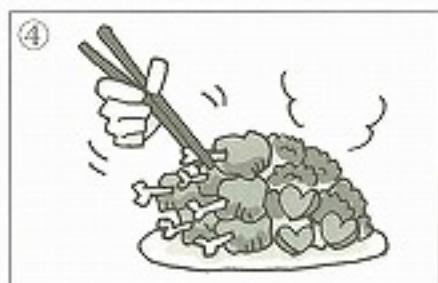
④料理を皿に _____。 ( )