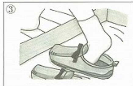
③靴を _____。 ( )