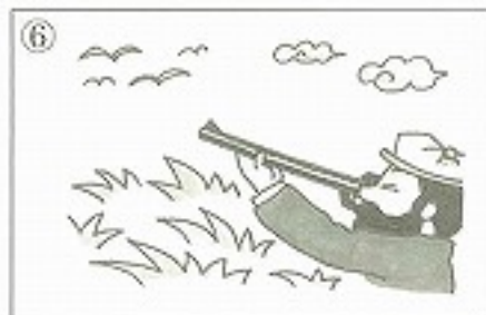
⑥鳥を _____。 ( )