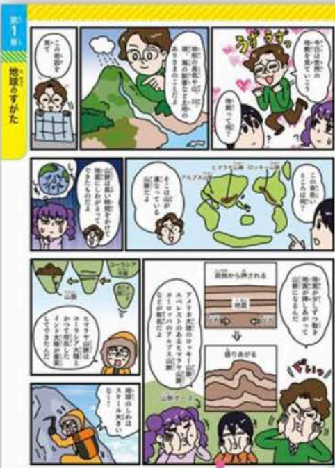
11 プレート 地球の表面にある巨大な塊の薄層プレートだ。このプレートが動くことで、プレート境界で火山が噴出したり地震が起きているんだ。