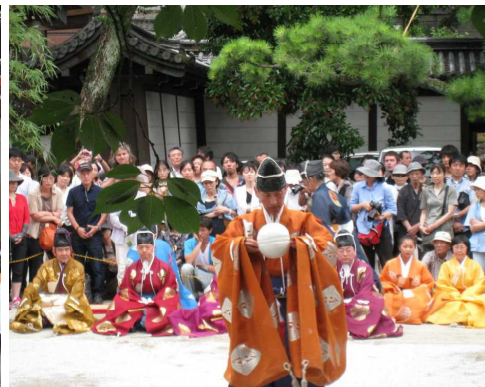
平安時代の貴族の遊び「蹴鞠」