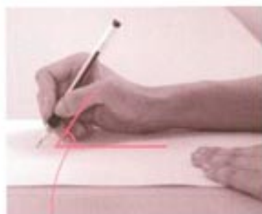
用紙に対してボールペンの角度は60°くらい。