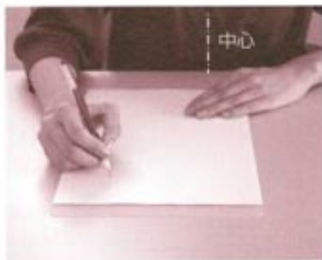
写真は対面から見た場合。用紙は右利きの場合、からだの中心よりやや右側に置き、もういっぽうの手は軽く添え、力を抜く。

縦書きの場合は、左手で用紙を上、横書きの場合は左にずらしながら書き進めるのがコツです。用紙と手の位置が正しくないと、まっすぐ書いているつもりでも右上がりになってしまったりもするので気をつけましょう。